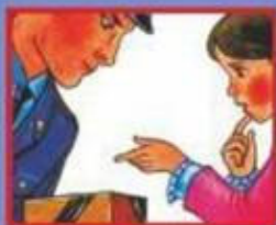
НА УЛИЦЕ ИЛИ В МЕТРО- ПОЛИЦЕЙСКОМУ