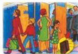
В ОБЩЕСТВЕННЫХ МЕСТАХ