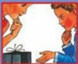
В МАГАЗИНЕ- ПРОДАВЦУ