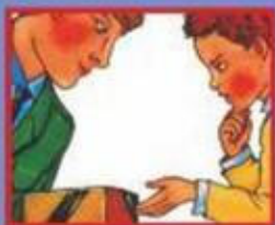
В ТРАНСПОРТЕ- ВОДИТЕЛЮ